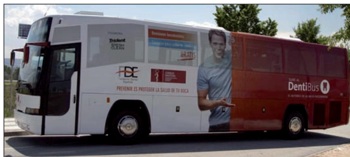
Imagen del Dentibús.

El Dentibús visitará el municipio de Las Rozas en las siguientes fechas y ubicaciones: