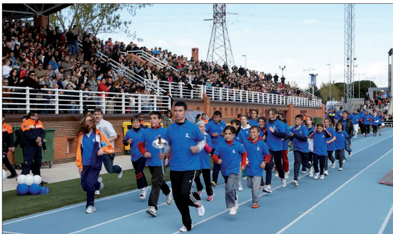
Entrada de los antorchistas en el Polideportivo de Navalcarbón.

Desde el lunes 16 al viernes 20 de abril, alumnos de todas las edades compitieron en 16 disciplinas –ajedrez, baloncesto, fútbol americano,