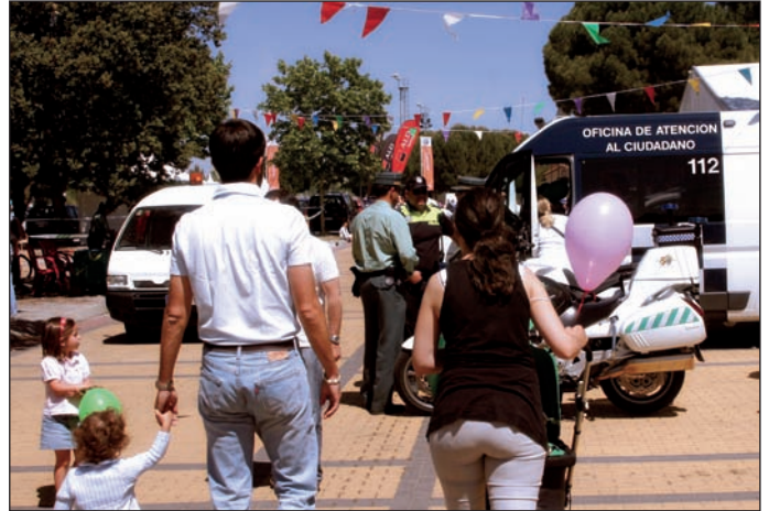
Las familias podrán disfrutar de esta jornada en el Recinto Ferial.

No faltarán los pasacalles protagonizados por zancudos, equilibristas y trapezistas. También están programados tres pases de cuentacuentos educativos para toda la familia. Habrá además hinchables y exhibiciones de los diferentes servicios municipales, que mostrarán cómo se organizan y funcionan. Como es habitual, la Agencia Anti-droga de la Comunidad de Madrid estará presente con un autobús informativo. Finalmente, a partir de las 14 h. se preparará una gran paella