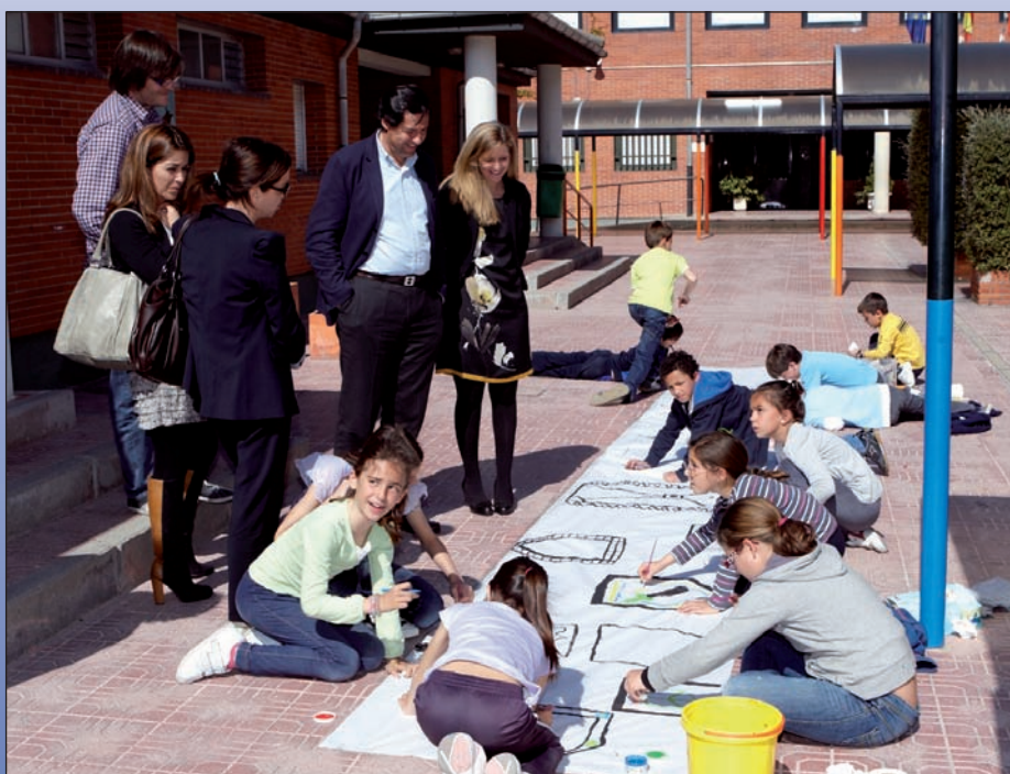
Actividades al aire libre en el programa “Días sin Cole”.

El programa “Días sin Cole” tiene un horario abierto de 7,30 a 19 horas y los precios oscilan desde los 14,16 a los 21,40 euros, en función del tiempo de estancia y si incluye o no alimentación. Para poder acceder a los “Días sin Cole” es necesario estar empadronado y ser residente en el municipio.