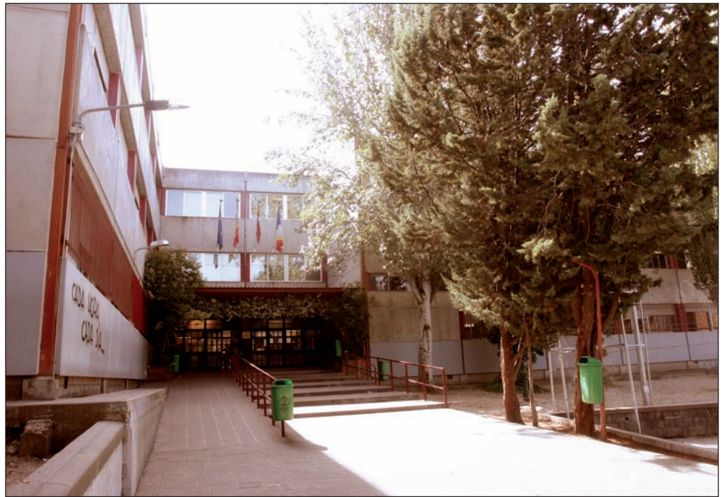
IES Las Rozas I.

Alumnos del Programa de Cualificación Profesional Inicial realizarán sus prácticas en el Ayuntamiento