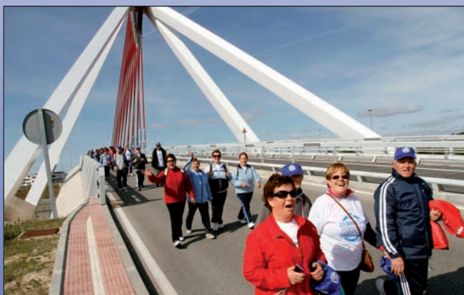
Imagen de la 23ª edición de la Marcha Popular de Mayores.

Más de quinientos mayores procedentes no sólo del municipio, sino también de otras localidades de la Comunidad de Madrid, participaron el pasado 24 de abril en la 23ª Marcha Popular de Mayores que, como cada año, discurre entre la Plaza Mayor y el Centro Cívico de Las Matas.