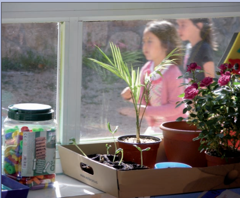
En este encuentro se han sumado nuevas familias a los Hogares Verdes de Las Rozas

sentación de la Guía del Agua de Las Rozas a todos los Hogares Verdes y se procedió la reparto de ejemplares de la misma a los asistentes.