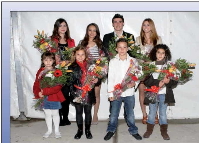
Reinas y reyes de las fiestas de San José Obrero 2012.