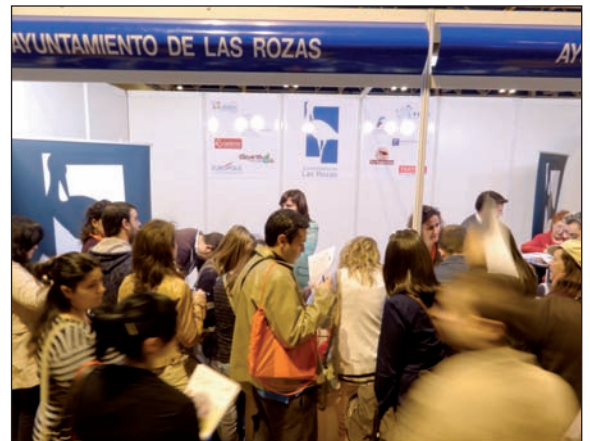
Imagen del stand del Ayuntamiento de Las Rozas.