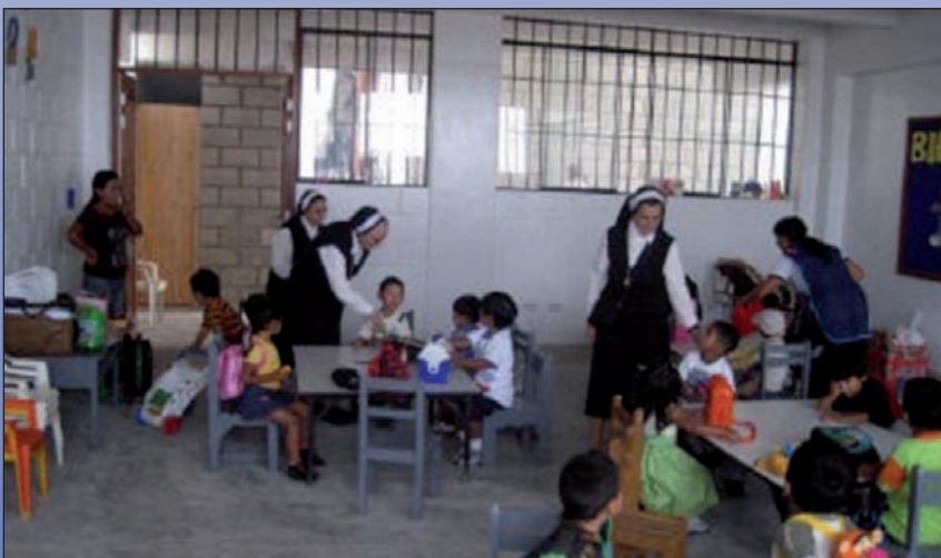
El colegio se inauguró el pasado 5 de marzo.

El pasado 5 de marzo se inauguró el Colegio Cristo Sacerdote de Villa Alejandro, ubicado en el barrio de Lurín, en Lima (Perú). La construcción de este centro educativo ha sido posible gracias al convenio firmado por el Ayuntamiento y la Asociación Santa María de Las Rozas para la Cooperación Internacional, una organización creada en el colegio del mismo nombre. El colegio ha empezado a funcionar con 3 cursos de infantil y ahora se están construyendo las aulas de Primaria. Cuenta inicialmente con 300 alumnos y llegará a los 2.000 a la finalización del proyecto.