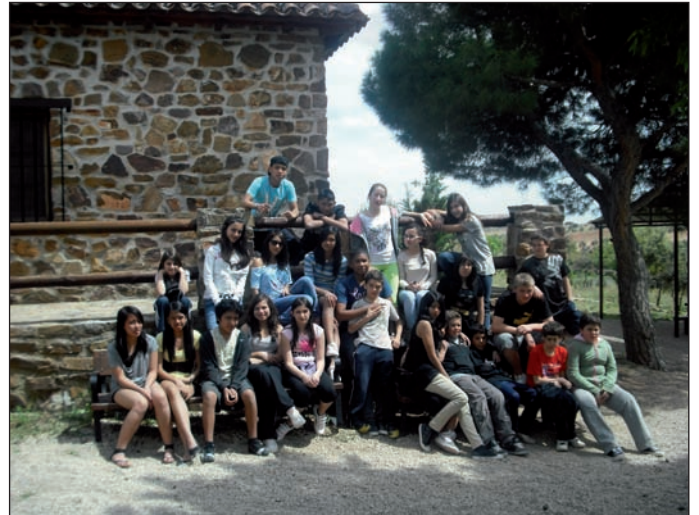
Campamento “Nuevos Talentos”.

Desde su inicio hasta la actualidad, 169 niños de Las Rozas han disfrutado del Programa Nuevos Talentos, un campamento basado en la convivencia, la tolerancia, el respeto a la naturaleza y la práctica intensiva del inglés. Con esta iniciativa se pretende premiar el esfuerzo, la dedicación y la buena conducta en el ámbito escolar de los chicos y chicas, con independencia de su origen, y así eliminar estereotipos que en ocasiones van asociados a la población inmigrante.