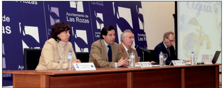
Imagen de la presentación.