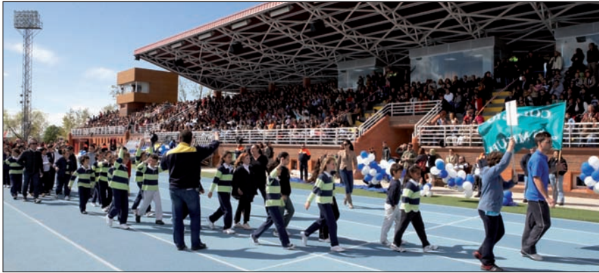
Desfile inaugural de las Olimpiadas Escolares.