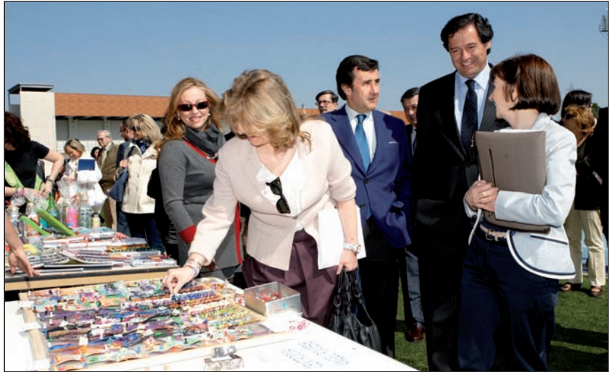
La jornada incluyó una exposición y venta de productos elaborados por las personas con autismo.

La Asociación Nuevo Futuro se encargó de organizar los actos centrales de este día en el Polideportivo Dehesa de Navalcarbón, donde se dieron cita representantes de distintas instituciones y entidades vinculadas con la discapacidad, así como niños y jóvenes con Trastornos del Espectro del Autismo (TEA). El momento más emotivo fue la entrega de los reconocimientos de la Federación Autismo Madrid a aquellas personas, instituciones y entidades que han destacado por su labor a favor del Autismo. Tras la lectura del manifiesto, el acto concluyó con el tradicional lanzamiento de globos. Durante la jornada se realizó una exhibición de actividades (deporte,