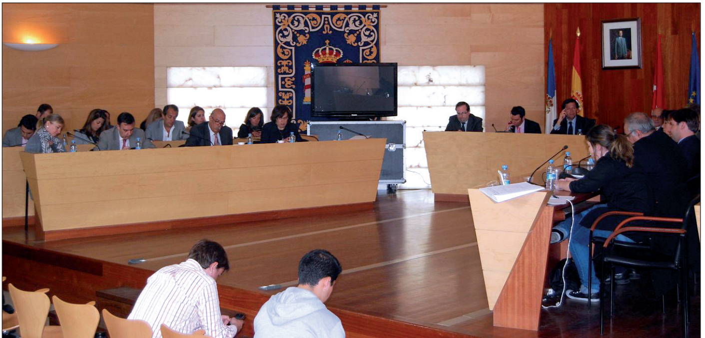
Un momento del Pleno.

El Pleno también acordó por unanimidad, a propuesta del PSOE, solicitar a la Comunidad de Madrid que inicie los trámites para declarar Bien de Interés Cultural tanto el Canal de Guadarrama como la Presa del Gasco. En este sentido, el Grupo municipal Popular recordó que la propuesta del Plan General de Ordenación Urbana de Las Rozas ya concede una especial protección a estas dos infraestructuras.