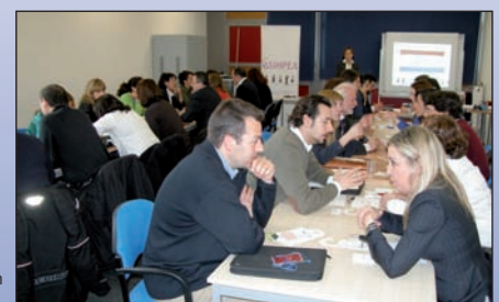
Las actividades pretenden apoyar a los emprendedores.

Todas las actividades se llevarán a cabo en el Centro Municipal El Cantizal C/ Kálamos nº 32