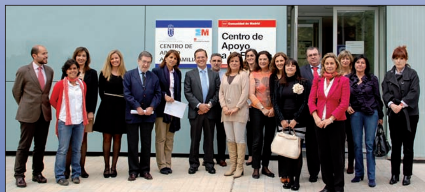
Asistentes a la segunda mesa de trabajo de la Red Madrileña de Municipios por la Familia.

El objetivo de este foro al que ya pertenece Las Rozas es constituirse en punto de encuentro para compartir experiencias así como poner en marcha nuevas iniciativas que apoyen y fortalezcan a las familias de los municipios que la integran. En estos primeros pasos de la Red, sus miembros se han comprometido a trabajar para mejorar especialmente el bienestar de las familias que se encuentran en situación problemática o de especial necesidad, ya sea por conflictos, violencia o dificultades económicas que pongan en riesgo la propia institución familiar.