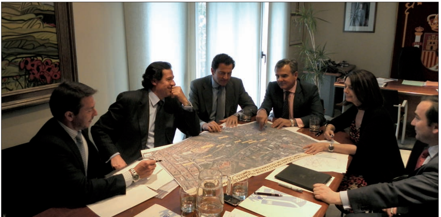
La reunión se celebró el pasado 12 de abril.

Concretamente, el proyecto se dividirá en dos tramos, uno entre Majadahonda y Las Rozas, cuya ejecución corresponde al Ministerio de Fomento, y otro en Madrid, comprendido entre la zona del Puente de los Franceses y Moncloa, que realizará la Comunidad de Madrid. Esta importante infraestructura beneficiará directamente a más de 300.000 vecinos de todo el Corredor de la A-6, tanto a los usuarios del transporte público -que tendrán una conexión directa con Moncloa- como a quienes utilicen el transporte privado, puesto que contribuirá a descongestionar el eje la carretera de La Coruña.