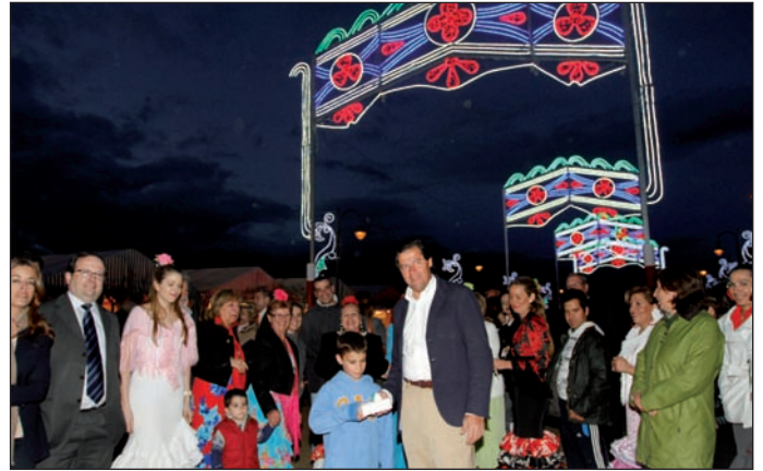
Momento del "alumbrado" que dio inicio a la Feria de Abril.

Dentro del programa de actividades, hubo concursos de rumbas, de sevillanas y de trajes flamencos, se ofrecieron diversas actuaciones y clases de rumbas. Este año se pudo disfrutar de nuevo del espectáculo ecuestre de Francisco Canales y de la degustación gratuita de vino fino.