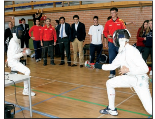
Los alumnos compitieron en 16 disciplinas deportivas.