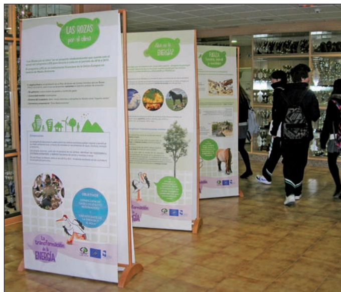
La exposición seguirá de manera itinerante por numerosos centros escolares.

La exposición seguirá de manera itinerante por numerosos centros escolares del municipio hasta el fin del actual curso escolar y principios del que viene. Los centros educativos que quieran sumarse a esta