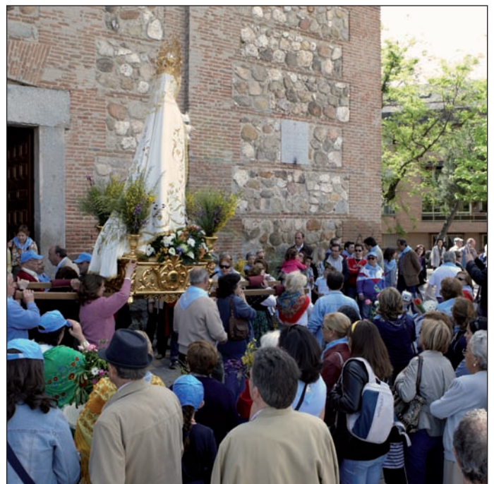
Procesión de Nuestra Señora la Virgen del Retamar.

Por la tarde, los participantes se miden en las distintas modalidades. No falta un concurso de chito en el recinto ferial y otro de bailes por parejas en el que los bailarines deberán demostrar su destreza en estilos como tango, pasodoble, salsa o rumba. La fiesta finaliza con la entrega de los premios a los ganadores de los diferentes concursos.